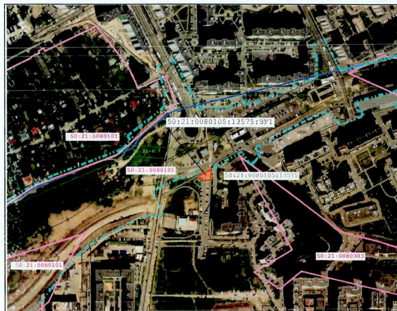
Масштаб 1:5 000