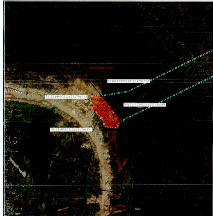
Масштаб 1:2 000