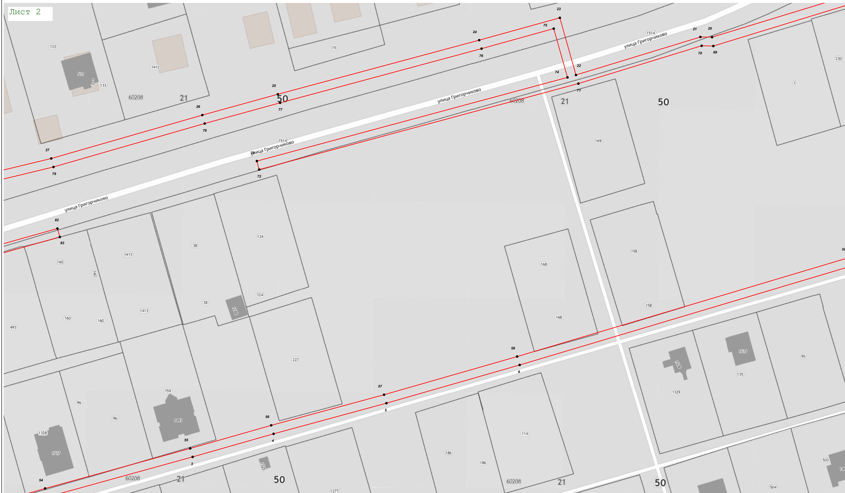
Масштаб 1:1 000