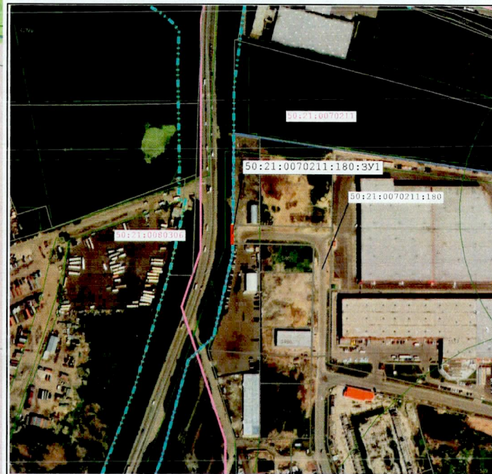
Масштаб 1:5 000