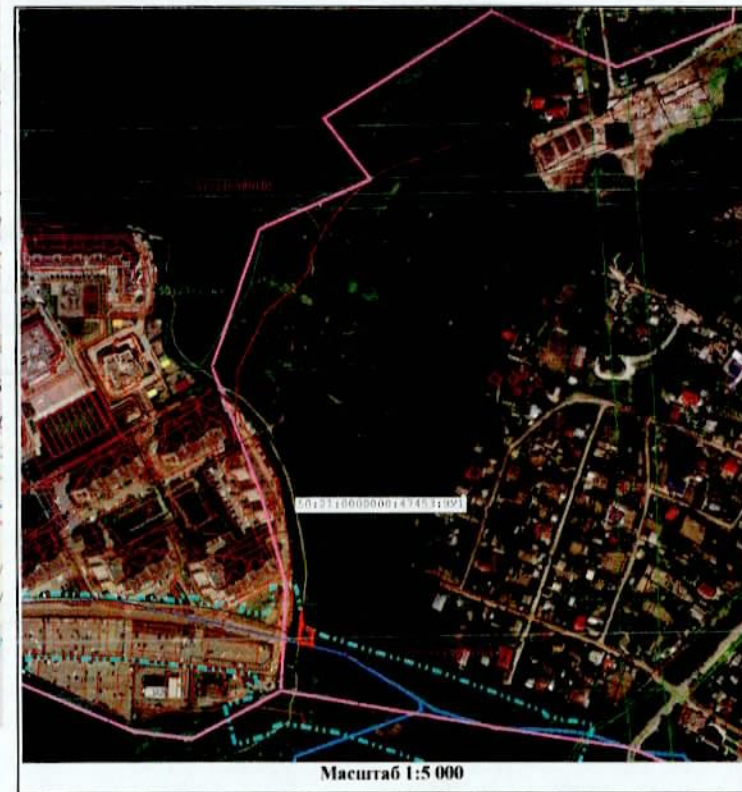
Масштаб 1:5 000