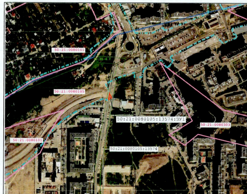
Масштаб 1:5 000